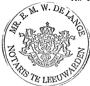
Mw A. Spiekstra-Dekkinga